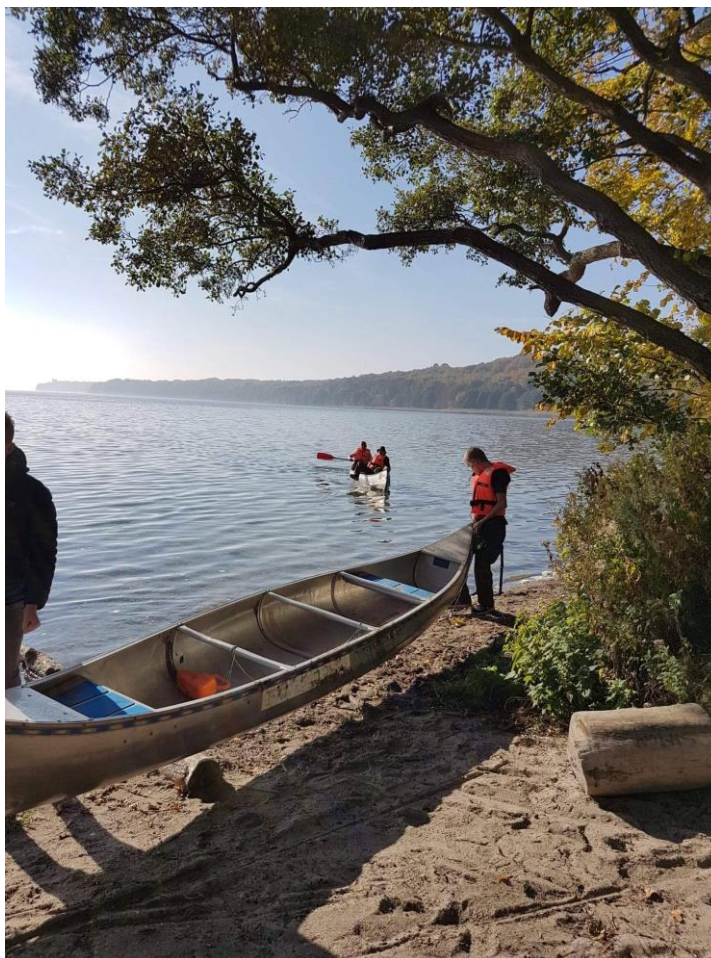
Fra motionsugen i uge 41