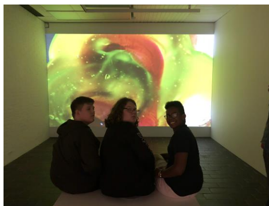
Kostelever til udstilling på Louisiana