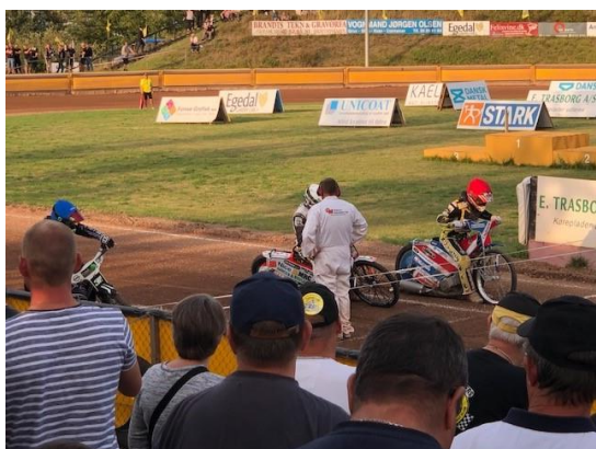
Elever fra kostafdelingen til speedway

Stemningen på kostafdelingen er rigtig god. Eleverne hygger sig med hinanden på kryds og tværs. Der er en rigtig hyggelig stemning til måltiderne, og når vi klokken 15 holder vores møder, hvor vi planlægger dagen. En del af eleverne er startet på deres aktiviteter. Vi har nogle der går til fitness, ridning og svømning. Der er også en gruppe på 3 elever, der er startet på at tage knallertkørekort på ungdomsskolen i Græsted. I løbet af den kommende tid vælger eleverne flere aktiviteter. Vi har planer om at starte et fodboldhold, et parkourhold og e-sport på skolen.