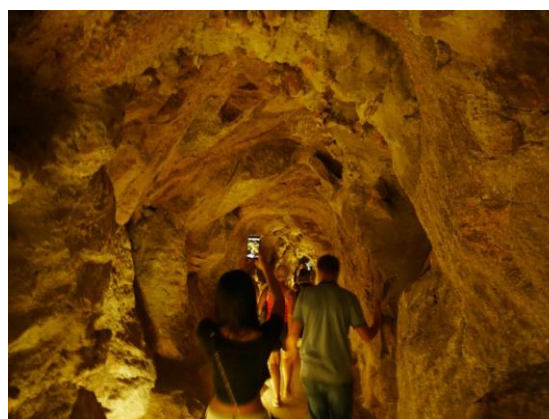
Palacio da Pena

Alt i alt en helt fantastisk sommerskole, fyldt med spændende oplevelser og meget motiverede elever. Eleverne havde det rigtig godt sammen. De hyggede sig, når der ikke var program, og vi var meget tilfredse med det Hostel, vi boede på. Der var ikke andre gæster end os, og personalet var meget søde og hjælpsomme. Vores største udfordring var varmen, men det klarede vi også. Alle drak rigeligt vand, og vi fik efter et par meget varme nætter installeret aircondition på værelserne.