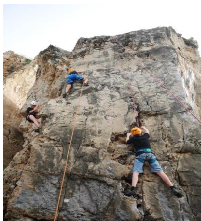
Klatring på sommerskolen

Området omkring Kap Roca var meget smukt og fascinerende. Her havde vi også en dag, hvor vi klatrede på klipperne, selvfølgelig med klatreinstruktører. De samme instruktører tog os også med på hiking i klippeområdet. Turen endte ved den skønneste strand, hvor vi kunne bade. Dagen før vi skulle hjem, var vi i Lissabon. Vi var i shoppingcenteret Vasco de Gama og gik rundt i de gamle kvarterer, hvor vi også sluttede dagen af med et restaurantbesøg.