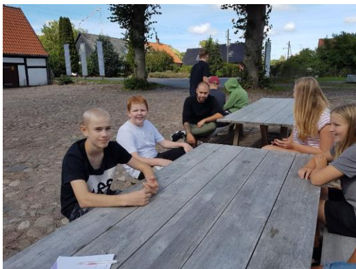
Elever laver research til teaterforestillingen på Klostret

Fagligt er vi kommet godt i gang. I matematik har vi lagt ud med noget logik og talbehandling for at provokere og træne vores hjerner. I engelsk føler vi os lidt frem med korte opgaver for at blive bekendt med hinanden, så alle tør sige noget i gruppen. Og i dansk er vi i gang med at skrive på stykket til jubilæet. Dem, der ikke er med her i denne proces, arbejder med grammatik og læsning.