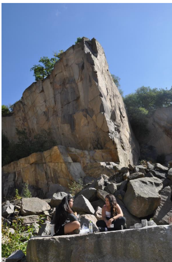
Fra lejrskolen på Bornholm